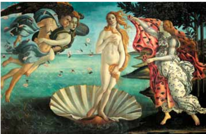
La nascita di Venere (Fæðing Venusar)