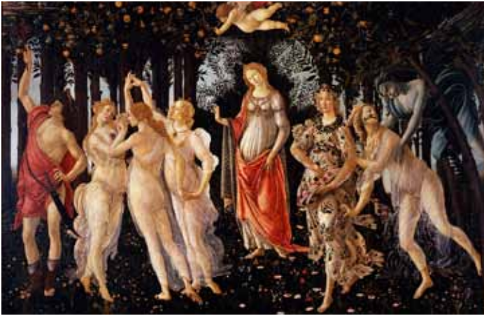
La primavera (Vorið)