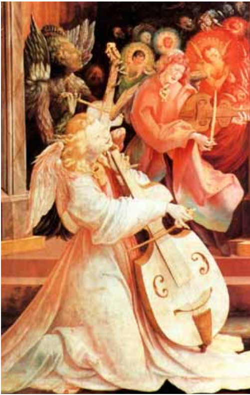
Engelkonzert (Hljómleikur englanna)