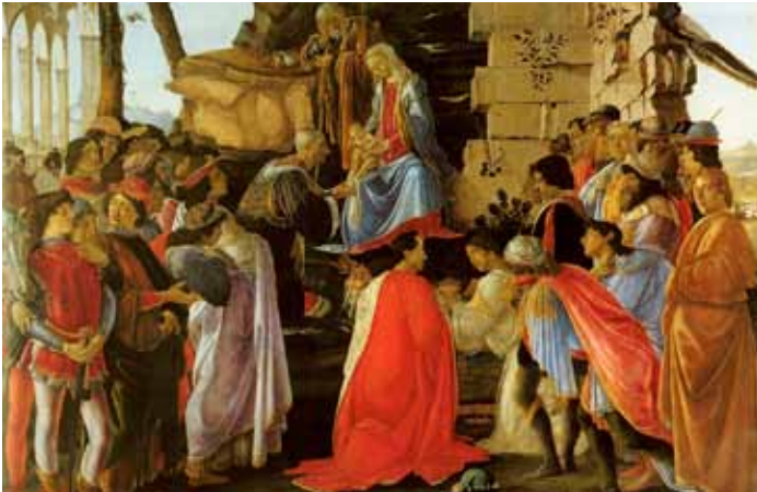
L'adorazione dei Magi (Vegsömun vitringanna)