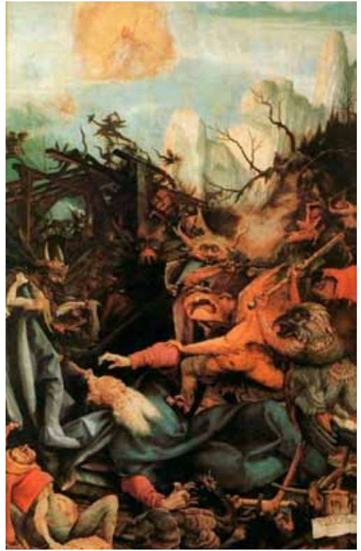
Versuchung des heiligen Antonius (Freisting heilags Antoníusar)