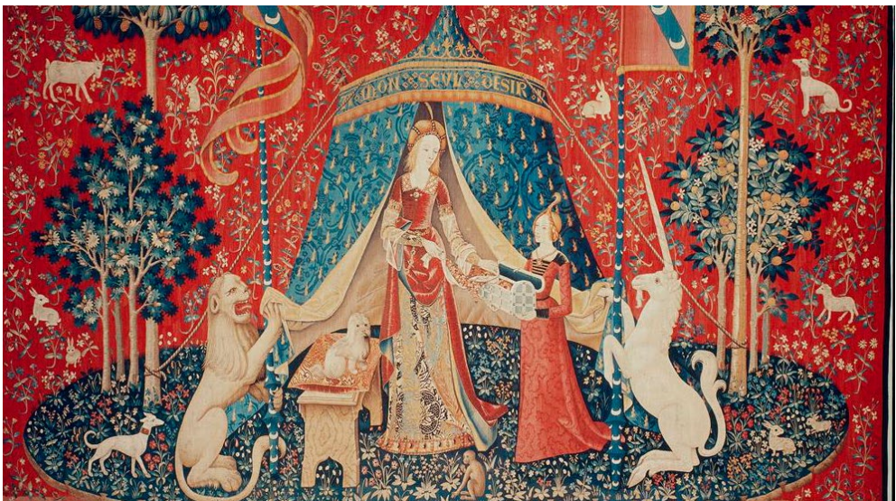
À mon seul désir, flæmskt veggteppi frá um 1500.