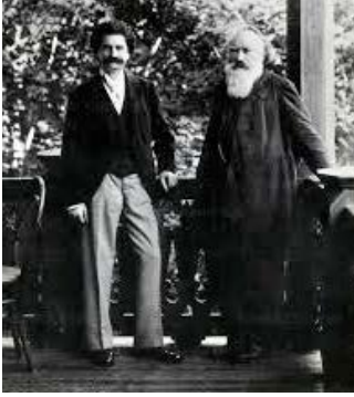
Johann Strauss og Johannes Brahms.