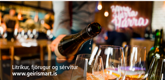
Litríkur, fjörugur og sérvitur www.geirismart.is