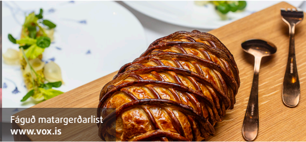
Fáguð matargerðarlist www.vox.is