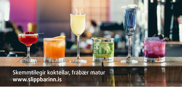
Skemmtilegir kokteilar, frábær matur www.slippbarinn.is