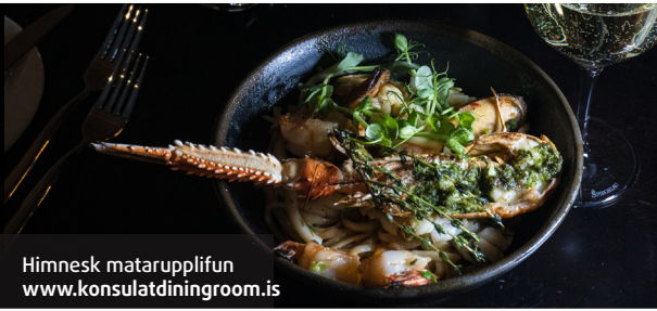
Himnesk matarupplifun www.konsulatdiningroom.is