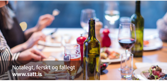
Notalegt, ferskt og fallett www.satt.is