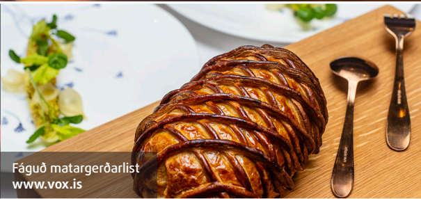
Fáguð matargerðarlist www.vox.is