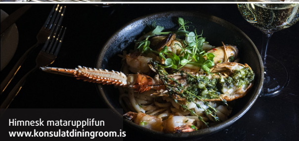
Himnesk matarupplifun www.konsulatdiningroom.is