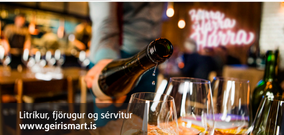
Litríkur, fjörugur og sérvitur www.geirismart.is