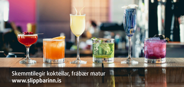
Skemmtilegir kokteilar, frábær matur www.slippbarinn.is