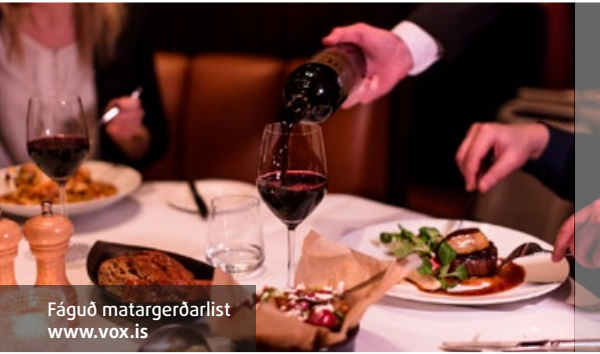
Fáguð matargerðarlist www.vox.is