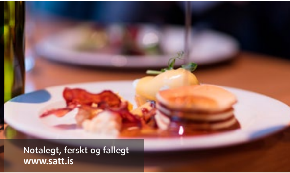
Notalegt, ferskt og fallegt www.satt.is