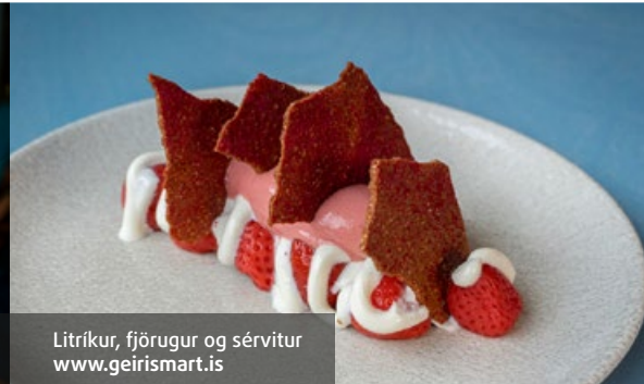
Litríkur, fjörugur og sérvitur www.geirismart.is