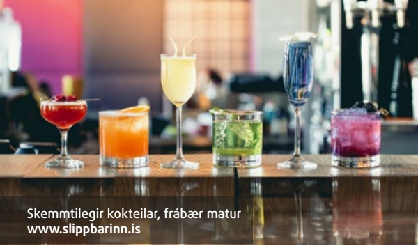
Skemmtilegir kokteilar, frábær matur www.slippbarinn.is