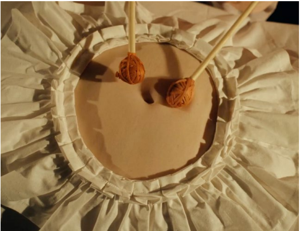
Flökkusinfónía / Vagus Symphony, úr kvikmynd, Gjörningaklúbburinn, 2024