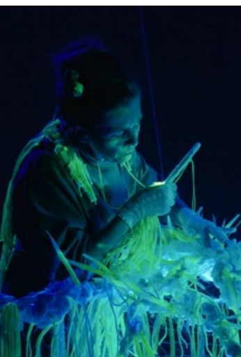
Flökkusinfónía / Vagus Symphony, úr kvikmynd, Gjörningaklúbburinn, 2024

Gjörningaklúbburinn hefur starfað óslitið frá árinu 1996. Hugmyndir hans tengjast oft félagslegum málefnum með feminískum áherslum í bland við glettni og einlægni. Unnið er í þá miðla sem þjóna inntaki verkanna hverju sinni, svo sem gjörninga, ljósmyndir og innsetningar. Verkfræði ömmunnar er iðulega innan seilingar, handverk og útsjónarsemi í bland við glæsileika og nútímatækni.